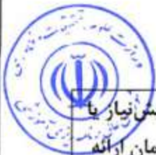
جدول ۲-۵- فهرست دروس انتخابی گرایش تغذیه طیور

فهرست دروس انتخابی دوره‌ی کارشناسی ارشد رشته‌ی علوم دامی در گرایش تغذیه طیور در جدول ۲-۵ ارائه شده است. دانشجویان این گرایش باید حداقل ۱۵ و حداکثر ۱۷ واحد را به پیشنهاد گروه تخصصی از جدول مربوط انتخاب نمایند.